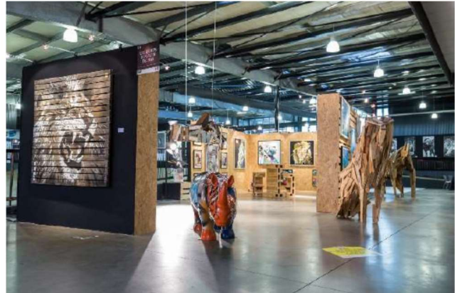
Stands – salon Atlantica (17 La Rochelle) – salon Art Up (76 Rouen)