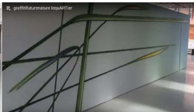
Supports d'œuvre d'art éphémère, sur mur autoporteur WALOOD®