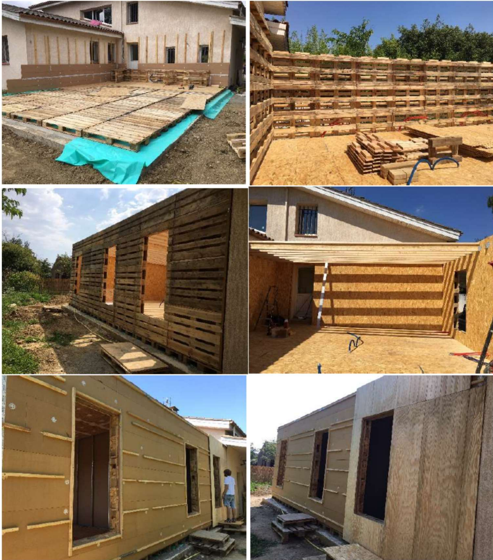
Extension 60m 2 d'habitation à Plaisance du Touch (31)