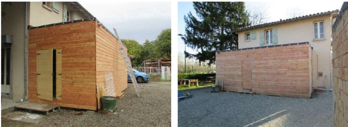
Extension avec toit végétalisé (31 Portet sur Garonne)